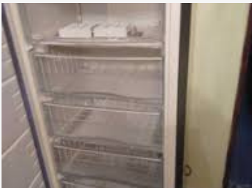
Freezer vertical para muestras de Biología Molecular