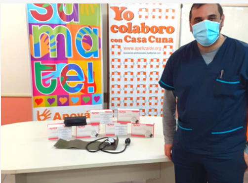
Tensiómetros De primera necesidad para el control y seguimiento de los niños que asisten a nuestra institución en las salas de internación