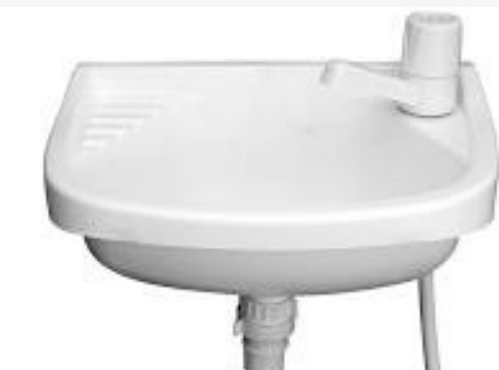
Bacha y grifería para el sector de Guardia y UFU