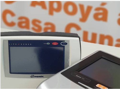
Software capnógrafo División Neumotisiología