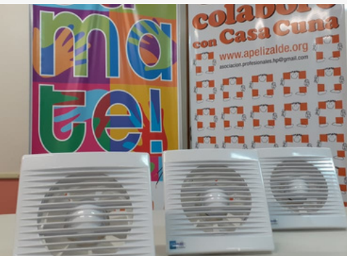
Extractores para ventilación y renovación de aire en los consultorios de Neumotisiología