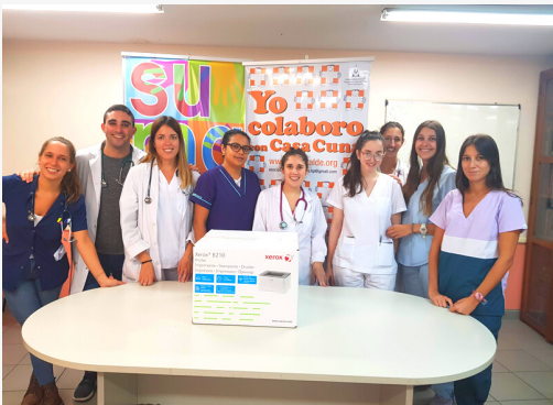
Impresora Xerox 3260 para pedidos de medicación, solicitudes de interconsultas, y la impresión de epicrisis que se entrega a la familia al momento del alta médica en el área de internación.