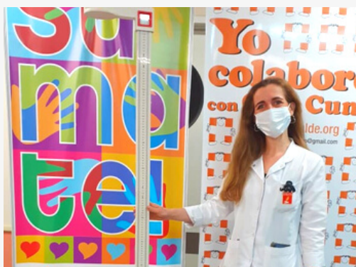
Altímetro elemento que permite la tarea diaria de las Lic. en Nutrición de Casa Cuna quienes trabajan para brindar una alimentación segura, completa y adaptada al momento evolutivo del niño.