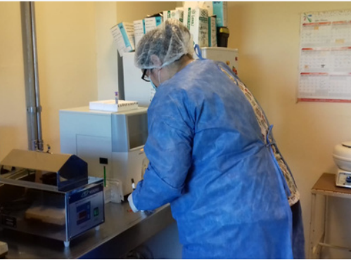
Baño térmico para realización de estudios en el servicio de Oncohemtología